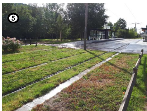
Cheminement piéton et tramway