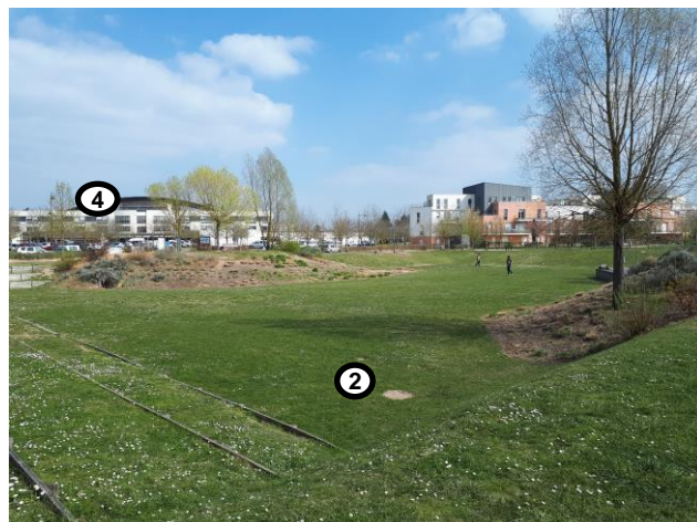
Vue du bassin d'infiltration du Parc du Larry, théâtre de verdure