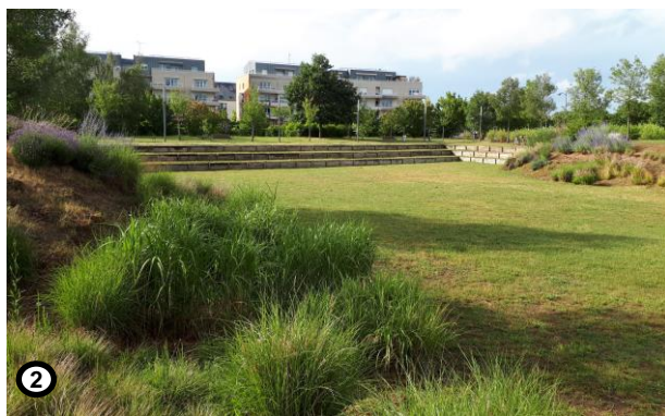
Bassin d'infiltration central du Parc du Larry

Lors du montage du projet, il y a eu une vraie volonté politique de conserver des espaces naturels pour cet aménagement. Les Parcs du Larry et de Saint-Fiacre font partie des circuits de balades à Olivet ce qui montre qu'on peut tout à fait combiner gestion des eaux pluviales et aménagement paysager tout en améliorant le cadre de vie et en facilitant les activités de loisirs et d'aménités.