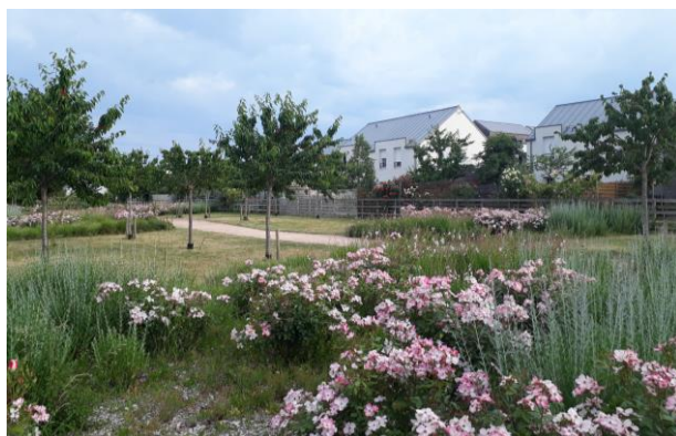
Plantes et diversité végétale