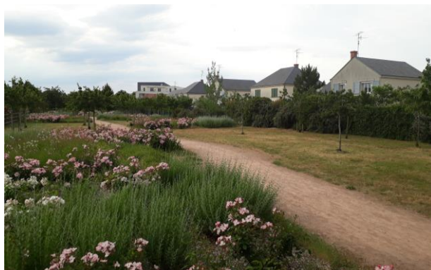
La Promenade des saveurs