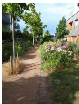
Promenades et venelles