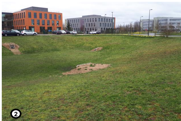
Bassin d'infiltration devant l'entreprise Axéreal